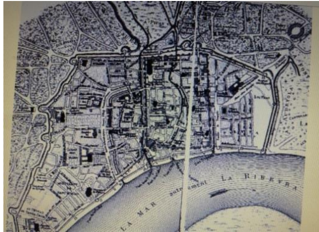
Les 3 ceintures médiévales de Bordeaux

La visite se termine par la porte Cailhau qui fut modifiée en 1495 et devait symboliser l'attachement des Bordelais au royaume de France ainsi que la victoire du roi Charles VIII à la Bataille de Fornoue, en Italie.