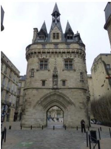
La porte Cailhau

La visite se termine par la porte Cailhau qui fut modifiée en 1495 et devait symboliser l'attachement des Bordelais au royaume de France ainsi que la victoire du roi Charles VIII à la Bataille de Fornoue, en Italie.