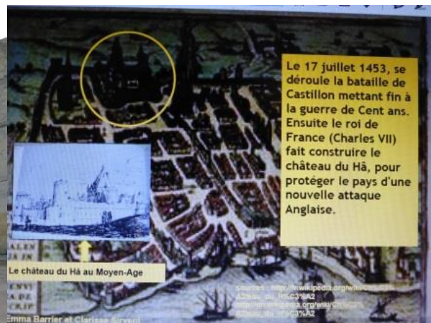
et au Moyen Âge