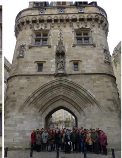
La porte Cailhau