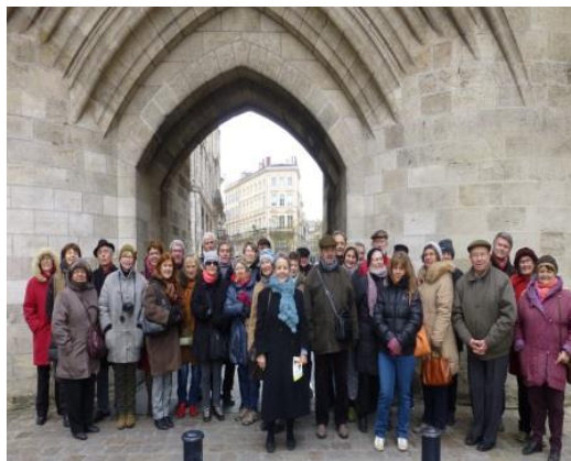
12h30 - Fin de la balade - Le groupe Aquitaine Historique