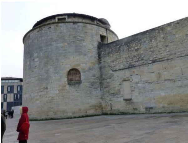
Fort du Hâ actuel

Depuis la place de la mairie actuelle, nous nous rendons au fort du Hâ . Après la fin de la guerre de Cent ans (Castillon-la-Bataille, le 17 Juillet 1453), le roi de France Charles VII fait élever des fortifications complémentaires : dans la ville, le fort du Hâ, à sa place actuelle, qui servit plus tard de prison jusqu'à la construction de la prison de Gradignan, et, à l'extérieur de la ville, le château Trompette (ou Tropeyte, sur le site de l'actuelle place des Quinconces). Ces constructions sont réalisées d'une part, pour empêcher une éventuelle reprise de la ville par les Anglais, mais aussi pour surveiller les Bordelais dont la colère gronde à cause des taxes imposées par le roi de France.