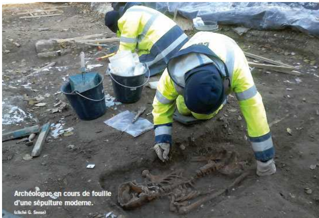
Archéologue en cours de fouille d'une sépulture moderne.